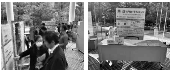
【日本応用老年学会の様子】 (写真を一部加工しております)