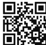
【公式ウェブサイトへのアクセスはこちらから】

7年目を迎えた「STOP! ヒートショック」プロジェクトは、ヒートショックにかかわる情報のポータルサイトとしての位置を確立しつつあり、各メディア等で取り上げられる機会もますます増加しています。更なる普及啓発のため、取り組みに共感いただける企業様の協賛を募集しております。