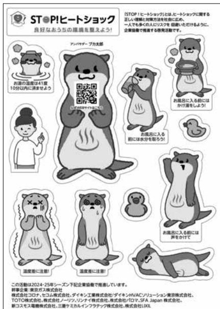
【2024年度啓発ツール例】(シール)

協賛各社での活用に加え、2025年始の東京消防庁出初式で来場するお子様に配布予定です。