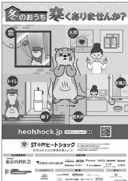
【2024年度啓発ツール例】(ポスター)