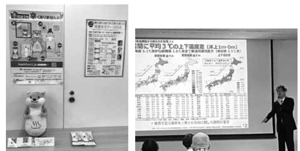
【東京内科医会市民セミナーの様子】 (写真を一部加工しております)

10月20日に行われた東京内科医会市民セミナー、11月9・10日に行われた日本応用老年学会へのブース出展など、外部セミナー・学会等においてもプロジェクト公式ツールの配布や対面でのご説明を通じて啓発活動を積極的に行っております。