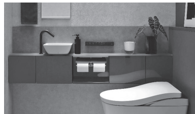
▲ブラックコーディネート